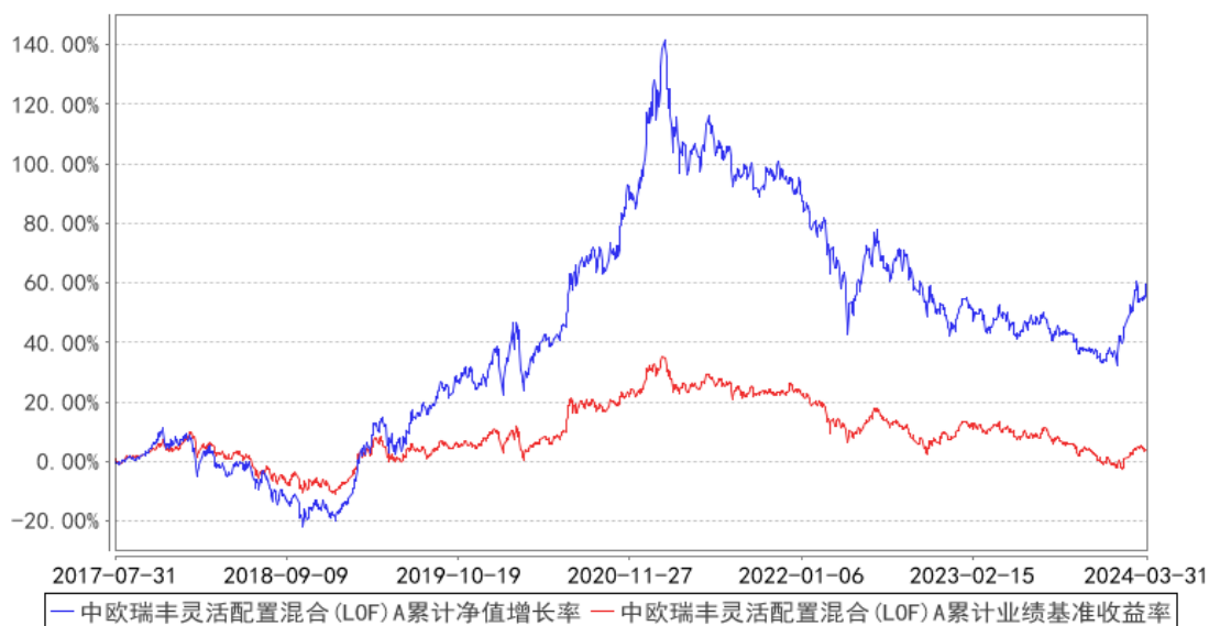
中欧瑞丰灵活配置混合 (LOF) A 累计净值增长率与同期业绩比较基准收益率的历史走势对比图